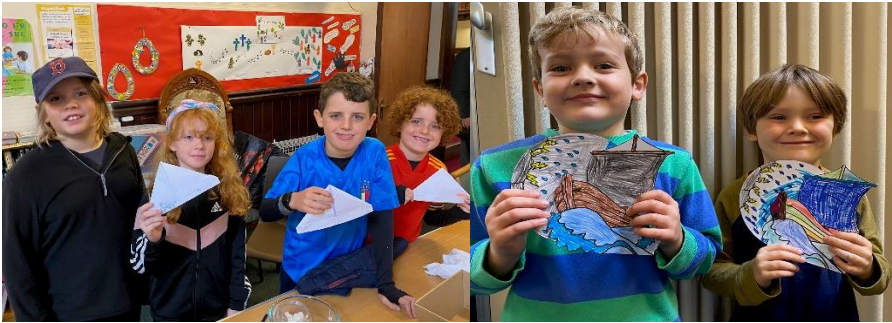
Iesu'n tawelu'r storm

Pan orffenwyd y gwaith o adeiladu'r muriau, dathlu a moli Duw gyda'u offerynnau wnaeth Nehemeia a'r Israeliaid a dyna wnaethom ninnau wrth ganu ac ysgwyd ein siglwyr potiau iogwrt.