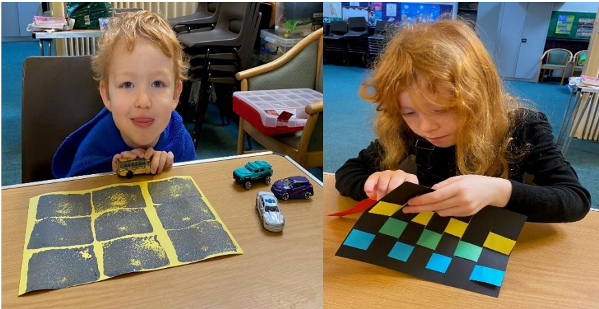
Nehemeia yn ail-adeiladu waliau Jerwsalem