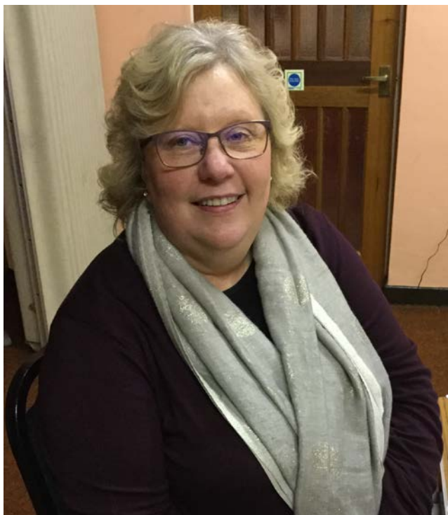
Croeso i Gapel y Morfa Elen Wyn Jones