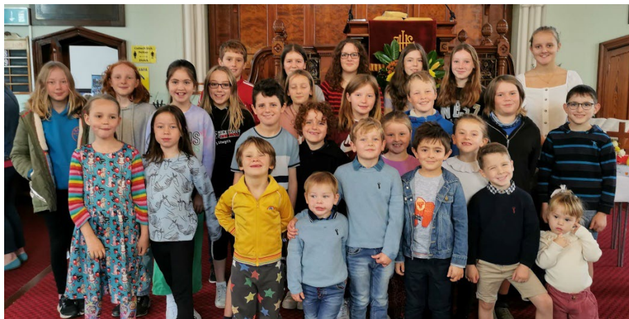
Y rhai fu'n cymryd rhan yn y Gwasanaeth Diolchgarwch a'r Brecwast.