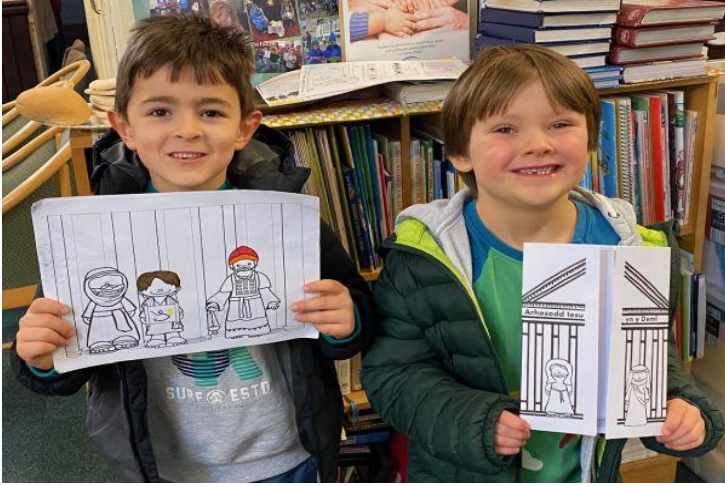
lesu yn y Deml yn 12 oed