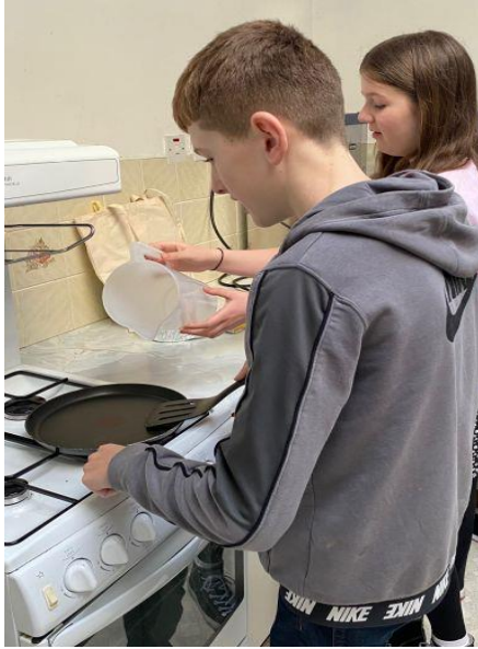
Gwaith tîm yn gwneud crempog