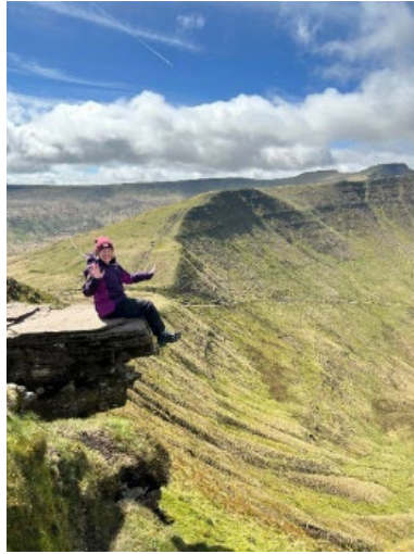
Sara'n ymlacio ar Fan y Big