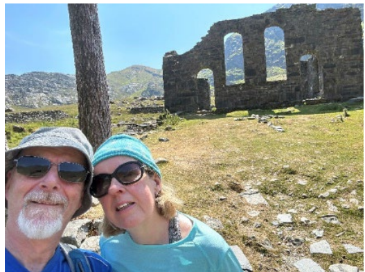
O flaen olion capel yng Nghwmorthin uwchben Tanygrisiau