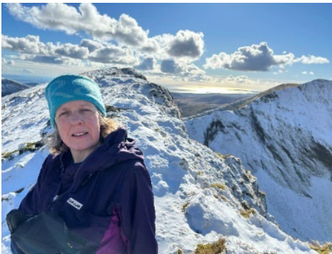
Ar Grib Nantlle