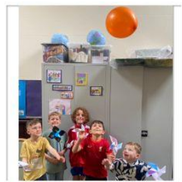
Hetiau a melinau gwynt y Pentecost