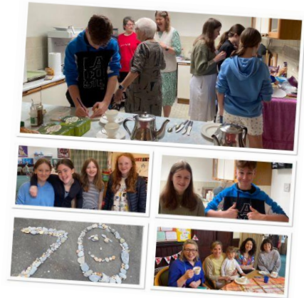
Brecwast o grempog gan yr ieuencid- byddant yn teithio 70 milltir ym mis Mai i godi arian i Gymorth Cristnogol.