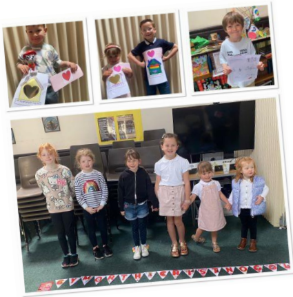
Câr dy gymydog (Wythnos Cymorth Cristnogol)